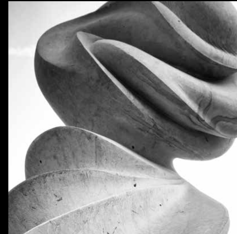
“السبيرة” للفنان سامي محمد الصالح، فندق منزل (اليسار) “القواسم” للفنان محمد العادي، مدخل كبار الشخصيات في فاشن أفنيو، دبي مول (الأعلى)